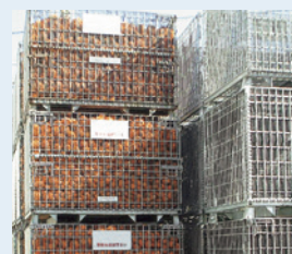
SCS-4 (フォークガイド付)