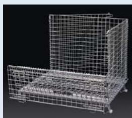
4側面を起こします