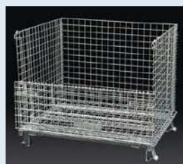
前面の扉を組み上げます