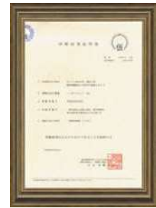
仮設工業会結果証明書 (吊下げ強度試験)